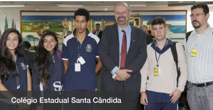
Colégio Estadual Santa Cândida