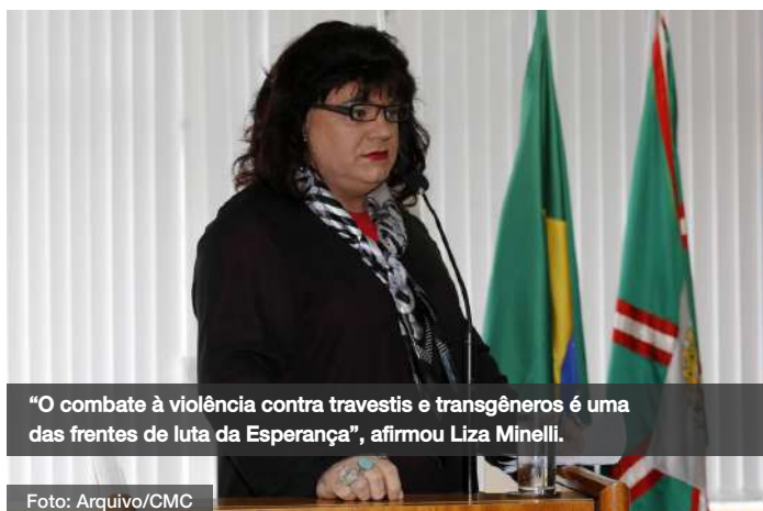
“O combate à violência contra travestis e transgêneros é uma das frentes de luta da Esperança”, afirmou Liza Minelli.