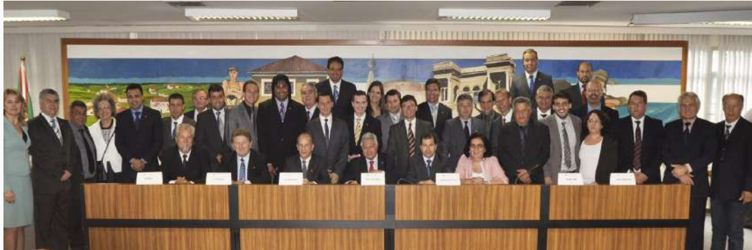
Vereadores na eleição da Mesa Diretora da 16ª Legislatura