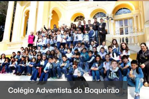
Colégio Adventista do Boqueirão