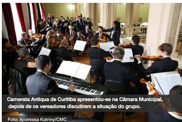
Camerata Antiqua de Curitiba apresentou-se na Câmara Municipal, depois de os vereadores discutirem a situação do grupo.