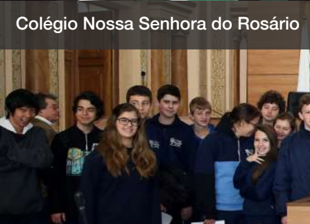
Colégio Nossa Senhora do Rosário