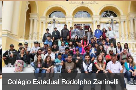
Colégio Estadual Rodolpho Zaninelli