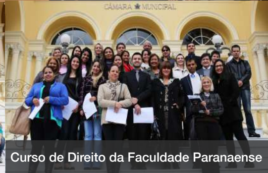
Curso de Direito da Faculdade Paranaense