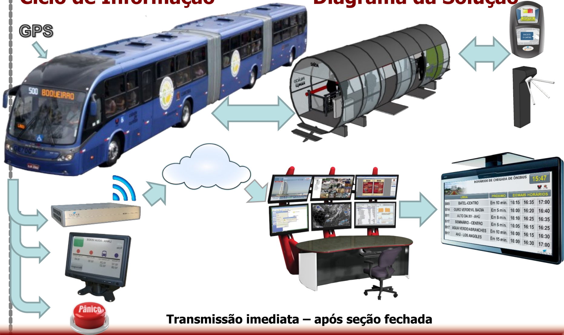
Diagrama da Solução